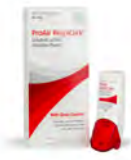
Pro Air RespiClick® (Teva Respiratory, LLC) o sulfato de albuterol