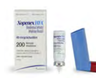
Xopenex HFA® (Sunovion Pharmaceuticals Inc.) o tartrato de leválbuterol