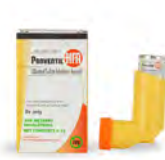
Proventil® HFA (Merck Sharp & Dohme Corp., una filial de Merck & Co., Inc.) o sulfato de albuterol