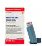
Ventolin® HFA (GlaxoSmithKline) o sulfato de albuterol