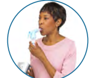
Sulfato de albuterol o Xopenex® (Sunovion Pharmaceuticals Inc.) o leválbuterol HCl

Por favor, consulte la ficha técnica completa de todos los productos.