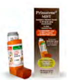
Primatene® MIST (Amphastar Pharmaceuticals) o epinefrina