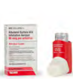
Pro Air® HFA (Teva Respiratory, LLC) o sulfato de albuterol